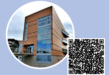
Lugar do campamento: Centro Municipal de Emprego (Os Rosais)